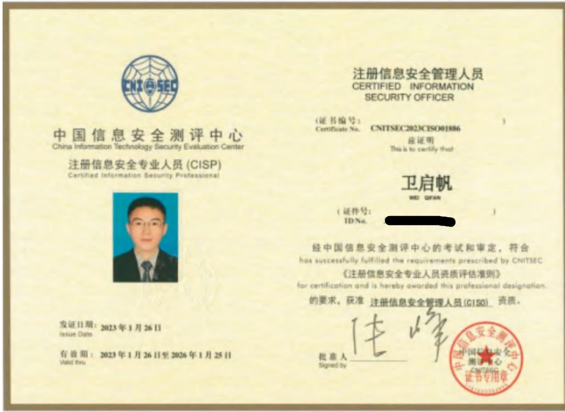
注册信息安全专业人员(CISP)证书