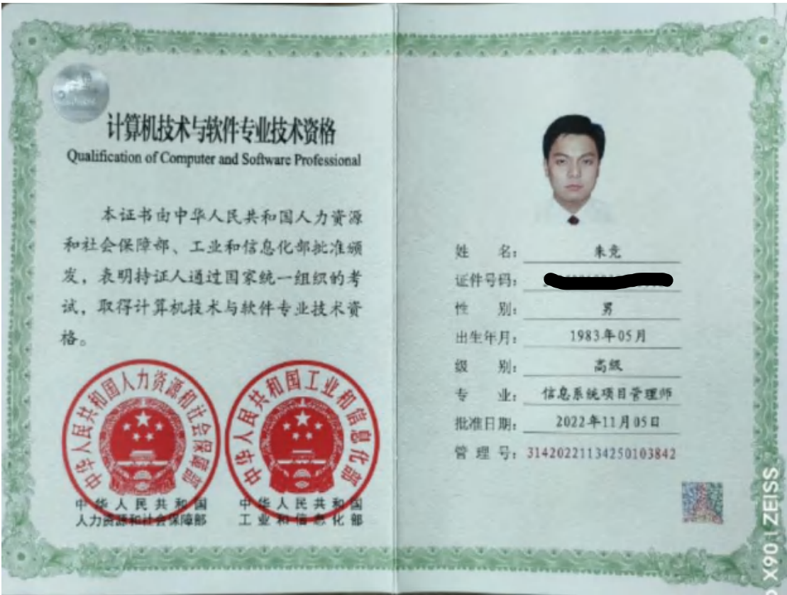
信息系统项目管理师证书