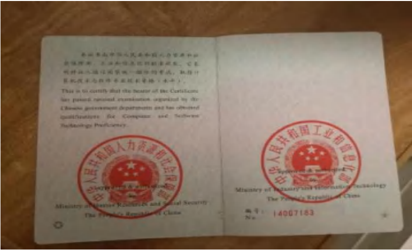
系统集成项目管理工程师证书