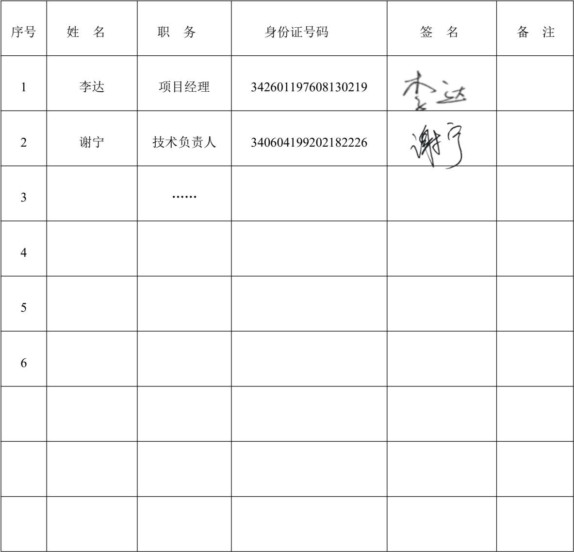
附件五：项目部主要管理人员签名备案表